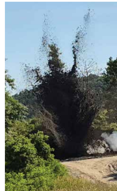
Il momento del brillamento

una bomba d'aereo da 500 libbre rinvenuta nel porto di Ancona.