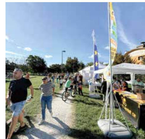
29 settembre 2024 - La festa nel parco letterario di Trebbo di Reno, con la partecipazione di tante realtà associative del territorio e il supporto della Pro Loco