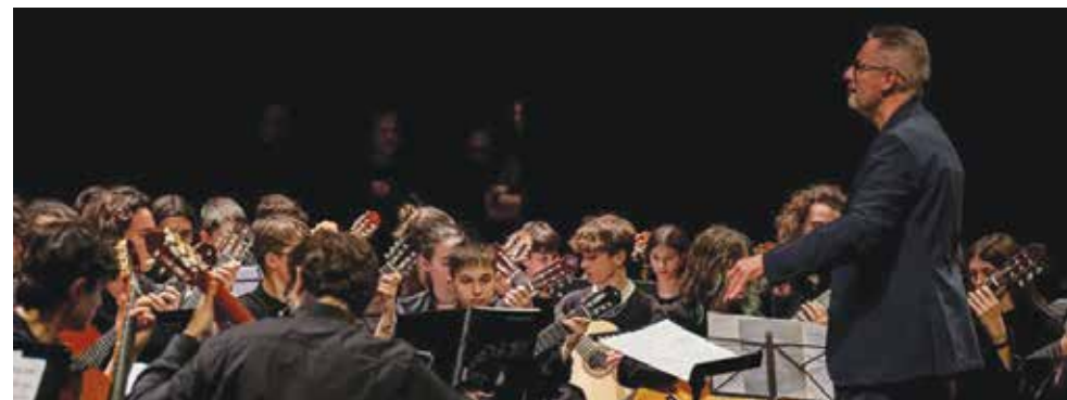
Felsina Guitar Ensemble dell'IC Castel Maggiore

Una serata di grande musica, emozione e partecipazione quella andata in scena lo scorso 27 maggio all'Arena del Sole di Bologna, dove oltre 300 studenti delle scuole secondarie di primo grado si sono alternati sul palco, in 7 formazioni musicali, nel concerto "Note in Rete". Tra i protagonisti, anche gli alunni dell'Istituto Comprensivo di Castel Maggiore, che hanno preso parte all'evento con entusiasmo e talento.