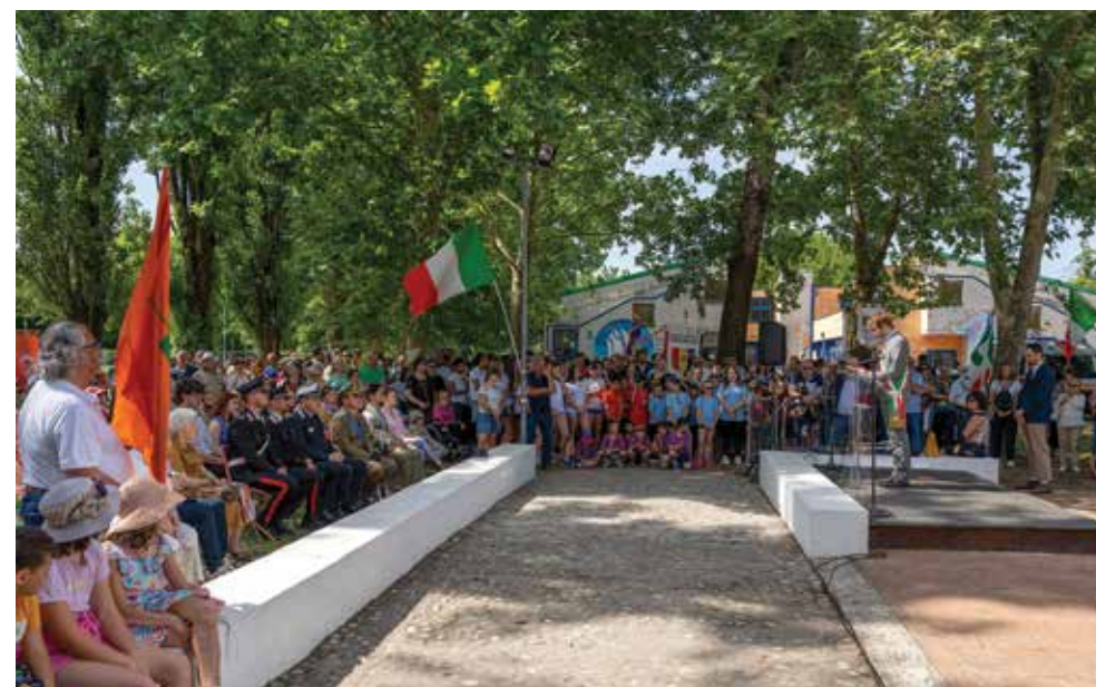
2 giugno: la festa della Repubblica