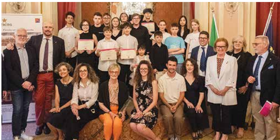
Staff e vincitori del Premio Alberghini 2025