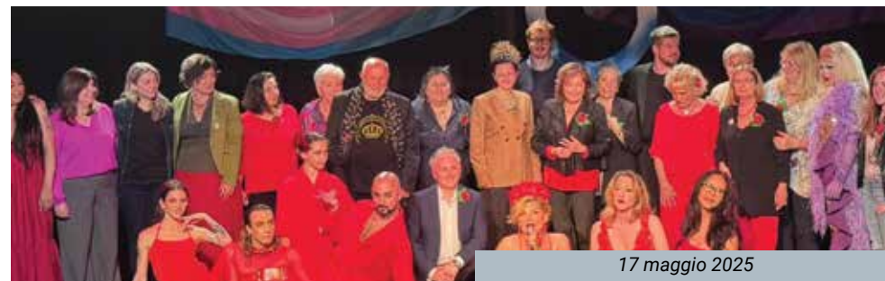
17 maggio 2025

I progetti della società civile nel campo delle Pari opportunità hanno dato vita ad esperienze molto importanti per il nostro territorio: da Zona Franca a Spazio Nausicaa a Uscire dal Guscio, diversi approcci hanno messo al centro la questione del rispetto delle differenze, la riflessione sul ruolo di scuola e famiglia nella prevenzione della violenza di genere. Il 17 maggio Rose Rosse ha promosso anche a Castel Maggiore la giornata contro l'omolebotransfobia con un grande evento al teatro