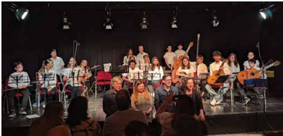
Gli alunni dell'indirizzo musicale delle Donini Pelagalli sul palco del Teatro Biagi D'Antona con i loro professori

Il 22 maggio scorso il Teatro Biagi D'Antona ha ospitato il concerto finale degli alunni dei percorsi ad indirizzo musicale della scuola secondaria di primo grado Donini Pelagalli.