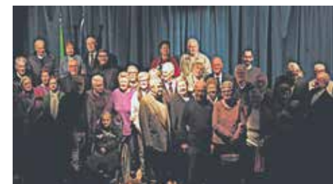
23 novembre 2024: festa per il sessantesimo di matrimonio