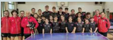
Il settore giovanile Maior Tennistavolo

Gli atleti, pur essendo alla loro prima esperienza a livello nazionale per alcuni, hanno dimostrato grande carattere e un notevole miglioramento nel corso della competizione. Tutti gli atleti si sono distinti per risultati, chi più, chi meno, ma sempre battendo avversari maggiormente quotati nel ranking federale.