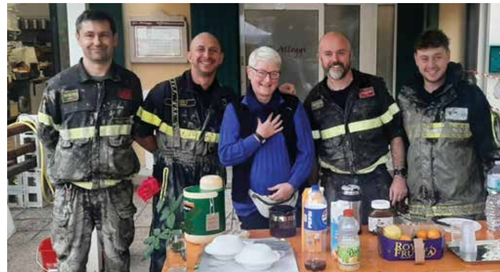
Punto di ristoro per volontari e operatori di Protezione Civile

idrovore. La mobilitazione della popolazione di Castel Maggiore ha portato anche alla raccolta di un ingente quantitativo di fondi, oltre 50.000 euro che insieme agli stanziamenti del Comune hanno permesso di portare un aiuto concreto a residenti e attività economiche di Castello.