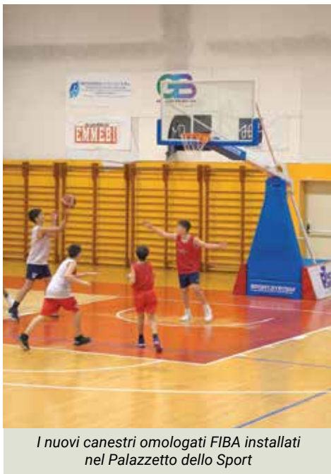
I nuovi canestri omologati FIBA installati nel Palazzetto dello Sport

Il Comune farà la propria parte, con investimenti già stanziati per 800.000 euro, destinati alla riqualificazione del palazzetto e all'acquisto di dotazioni ricreative, e posso già anticipare una notizia attesa da molti: nell'area bar torneranno gli storici biliardi che hanno riuni-