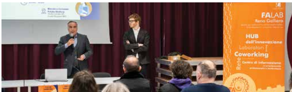
25 marzo il Fa-Lab presenta iniziative nel campo della ricerca del lavoro, della formazione professionale, delle opportunità di arricchimento professionale, dell'autoimprenditorialità