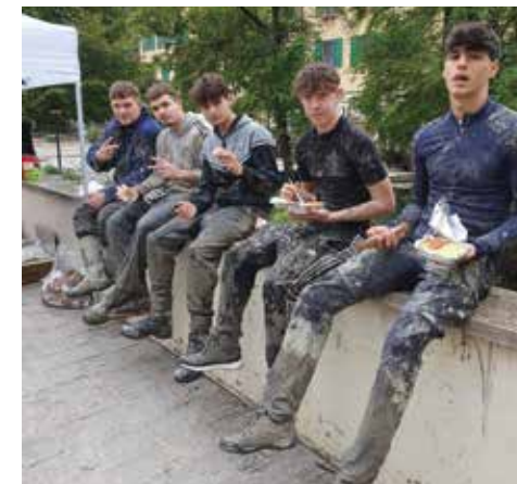
Una lezione particolare per questi studenti del Keynes

Sabato 19 ottobre intorno alle 22.30 il Navi- le ha iniziato ad esondare a Castello, dove l'acqua ha continuato a crescere fino quasi alle 5 di mattina. L'acqua ha raggiunto livelli molto superiori a quelli di maggio 2023, tanto che in via Albertina le unità specializzate dei Vigili del Fuoco arrivati da Ferrara e del Genio Ferroviario, hanno potuto trarre al sicuro poche persone. Solo alle 6 del mattino, quando l'acqua ha iniziato ad abbassarsi, è stato possibile evacuare i residenti ancora presenti, che si erano messi in salvo salendo ai piani superiori delle palazzine. Domenica sono giunte colonne attrezzate della Protezione Civile dal Lazio e dalla Valle d'Aosta, aggiungendosi alle attrezzature della Croce Italia e della locale protezione civile. In questo contesto di difficoltà ha lasciato un segno profondo la grande partecipazione di centinaia di volontari, in gran parte ragazzi e ragazze, che hanno dato un apporto determinante per la pulizia dal fango delle strade e dei locali dopo l'intervento delle