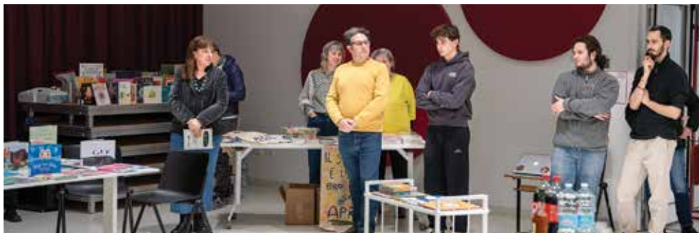
Junior Poetry Center - Il 31 gennaio buffet poetico internazionale per festeggiare il successo della campagna di crowdfunding per sostenere il progetto

campi che creano prospettive per ragazze e ragazzi che vogliono impegnarsi e mettersi in gioco.