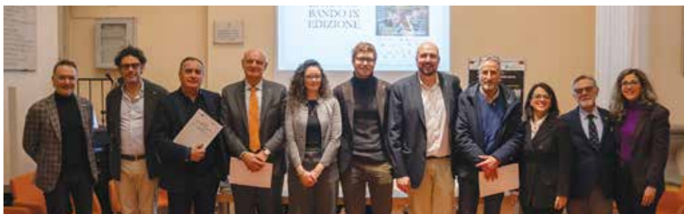
Il Premio Alberghini per giovani musicisti e compositori ha la capacità di mobilitare grandissime competenze intorno a un progetto di valorizzazione delle competenze e della capacità in ambito musicale che ha trovato notevoli riscontri