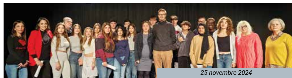
25 novembre 2024

Il 25 novembre 2024 ragazzi e ragazze delle scuole medie D. Pelagalli hanno partecipato allo spettacolo teatrale "Trátame Bien", messo in scena dagli studenti e dalle studentesse dell'Istituto J. M. Keynes, in occasione della Giornata Internazionale per l'Eliminazione della Violenza contro le Donne, nell'ambito di Uscire dal Guscio.