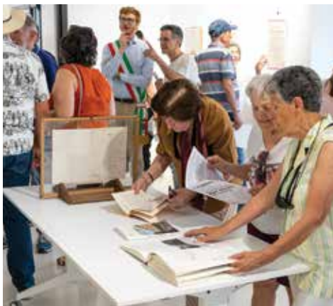
Mostra "i simboli di Castel Maggiore"

Anche alla luce di quella novità, abbiamo voluto cercare le tracce in questo ultimo anno del collettivo di Castel Maggiore, di tutte