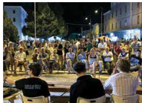
7 settembre 2024 - la Notte Bianca promossa dai commercianti è ormai un appuntamento irrinunciabile della ripresa dopo le ferie: alla grande attività dei soggetti economici ed aggregativi del territorio ha fatto riscontro un'altissima partecipazione di pubblico

Una comunità cresce anche attraverso i momenti di gioco e di aggregazione, costruiti da tante realtà