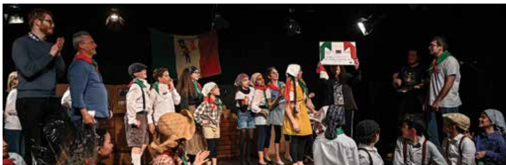
La Resistenza raccontata dai bambini: un commovente spettacolo costruito dagli alunni della 5°C delle Bertolini