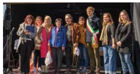
La tradizione prima di tutto. Con il supporto della Pro Loco e delle realtà associative si celebra a Trebbo la Festa della Raviola, che con le sue 213 edizioni vanta il titolo della più antica sagra della provincia di Bologna