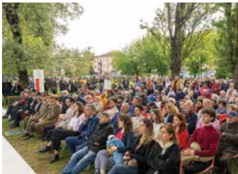
La manifestazione del 25 aprile

La celebrazione della Festa della Liberazione, lo scorso 25 aprile, ha registrato una grande partecipazione: grazie all'impegno con l'ANPI di tante e tanti, nelle scuole, nel sapere, nell'organizzazione di eventi e presentazioni di libri, cresce a Castel Maggiore la consapevolezza dell'importanza della guerra di Liberazione e dei valori fondanti della nostra Repubblica.