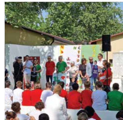
Un momento della manifestazione

Un messaggio potente, che nasce proprio dalla memoria della Strage di Capaci del 23 maggio 1992, una ferita ancora aperta per il