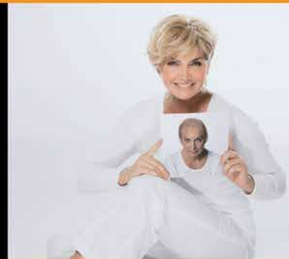
Immagine Stile Parrucchieri