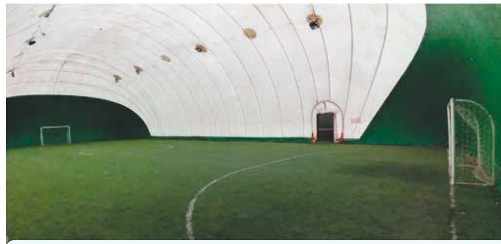
Il campo coperto per la scuola calcio