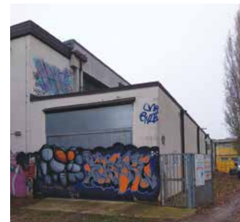
L'edificio spogliatoi e palestra Roccia

questa supportata dai volontari con ottimi risultati degli atleti della Polisportiva. Presso la struttura ex Bocciofila, la Federazione FIJKAM (CONI) organizza nei fine settimana seminari e aggiornamenti per i propri