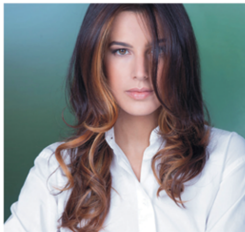
Immagine Stile Parrucchieri

via p.neruda 4/a | Castel Maggiore | tel. 051.6320694