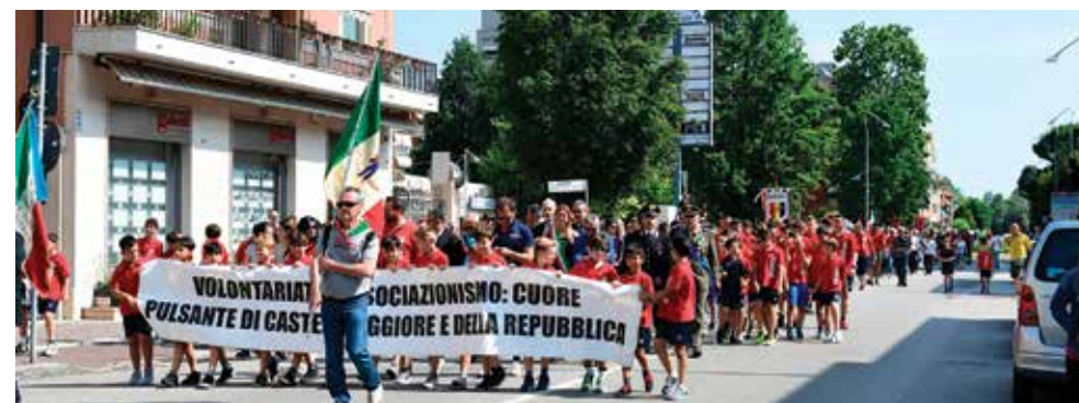
Festa della Repubblica 2018: in prima fila le società sportive del territorio