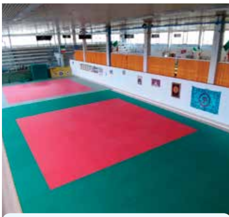
Palestra arti marziali

La Polisportiva ha una convenzione con il Comune per la gestione degli impianti sportivi, che scade nel 2024. Gli impianti sono il Palazzetto, la Bocciofila (oggi utilizzata per le arti Marziali), il Palatenda, la Palestra di Trebo di Reno, la Palestra della scuola Media, la Palestra scolastica delle scuole Bassi, la Palestra scolastica delle scuole Bertolini. Il monte settimanali di utilizzo di queste strutture, dal lunedì al venerdì è di circa 200 ore settimanali, che suddiviso per struttura sono circa 28 ore a settimana, cui si devono aggiungere le ore di utilizzo per le partite di campionato che si svolgono al Sabato e Domenica. Questo sistema sta permettendo di raggiungere grandi risultati. Da quattro anni la Società Progresso Fontana con i propri volontari, circa un centinaio, organizza i campionati Italiani di Pattinaggio a Rotelle, manifestazione di quattro giorni che registra la partecipazione di atleti provenienti da tutta Italia, con la presenza di circa 3.000 persone tra atleti e accompagnatori. Altro grande evento è la "Corrida" la mezza maratona che