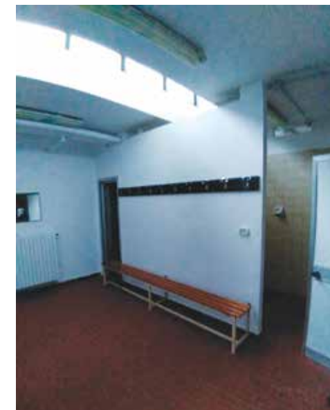
Effettuati a novembre i lavori di sistemazione degli spogliatoi del Palazzetto