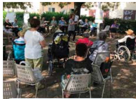
Amarcord Caffè: incontri gratuiti e liberi giovedì ore 9.30/ 11.30, presso Centro Sociale S. Pertini, via Lirone 30, Castel Maggiore. Per informazioni: Psicologo S. Rosano

Basta presentarsi agli operatori, dando loro modo di capire, dalle nostre parole, quali siano gli elementi della nostra vita quotidiana e i nostri bisogni. Sono veri amici e sono capaci di essere presenti solo quando abbiamo bisogno del loro appoggio. Nella vita può capitare di tutto, come avere difficoltà a fare la spesa, vivere ai piani alti di una casa senza ascensore e far fatica ad uscire. Spesso i figli sono occupati, per cui