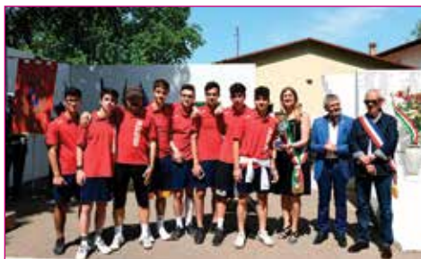
Merito sportivo a Progresso Calcio - Allievi Regionali 2001.