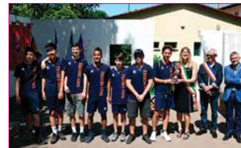
Merito sportivo a Trebbo UDC 1979 Giovanissimi Provinciali 2003. ■