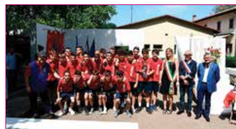
Merito sportivo a Progresso Calcio Giovanissimi 2004.