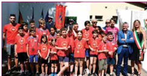
Merito sportivo a Atletica Polisportiva Progresso Categorie Giovanili.