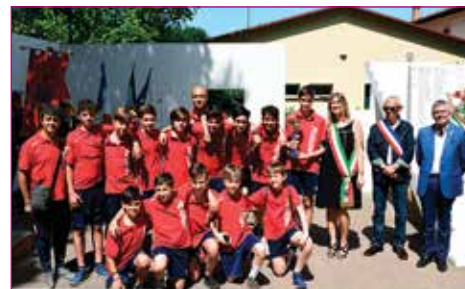
Merito sportivo a Progresso Calcio Esordienti Provinciali 2005.