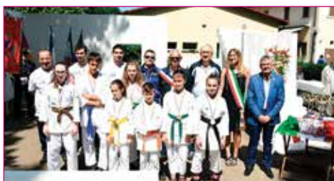
Merito sportivo a Polisportiva Progresso Sezione Judo e Sezione Karate.