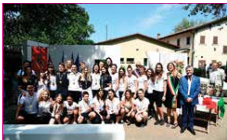
Merito sportivo a Progresso Fontana Pattinaggio.