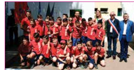
Merito sportivo a Progresso Calcio Pulcini 2007.