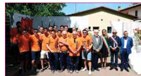
Merito sportivo a Trebbo UDC 1979.