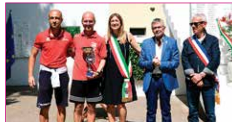
Merito sportivo a Progresso Calcio Allievi Interprovinciale 2002.