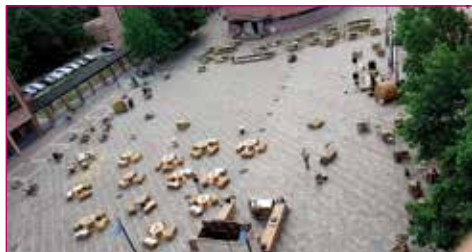
L'incredibile allestimento di Piazza Amendola con l'Osteria 1818.