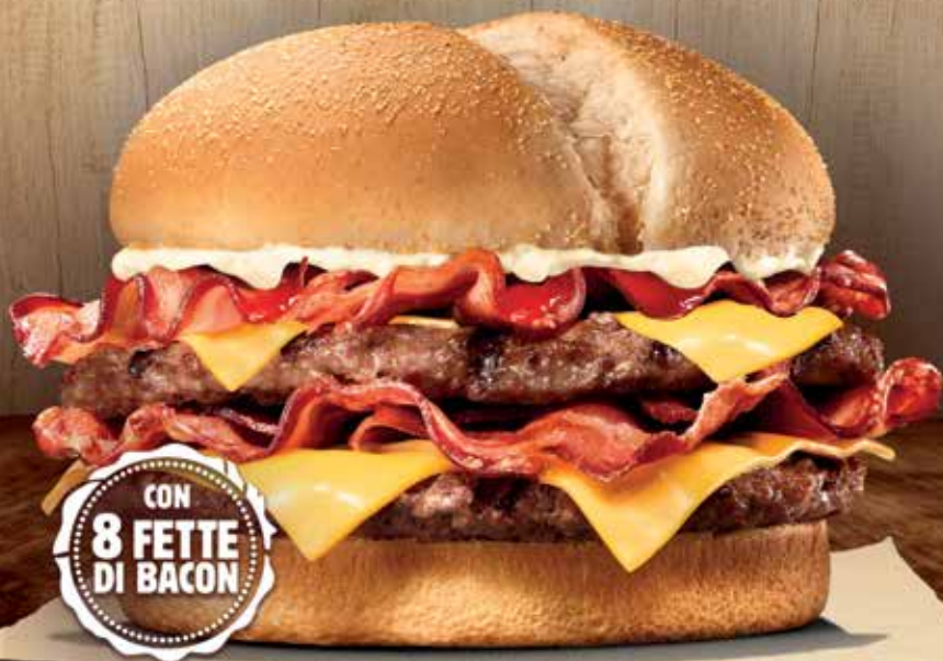
Immagine al solo scopo illustrativo. Offerta valida dal 22 Giugno 2017 nei ristoranti affiliati e che aderiscono all'iniziativa. La presente offerta è soggetta a disponibilità del prodotto. TM Burger King Corporation. ©2017 Burger King Europe GmbH. Tutti i diritti riservati.