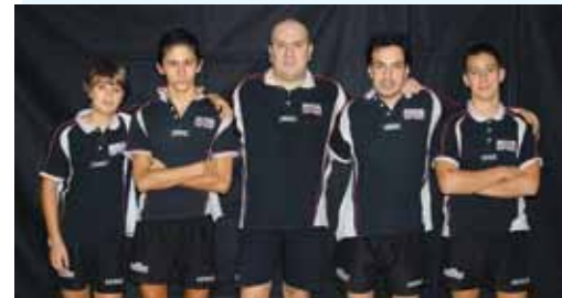
La Maior R1