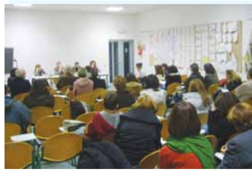
L'assemblea sulla scuola del 19 novembre

maggiormente a cuore alle nostre concittadine e ai nostri concittadini. Un'opportunità che non capita tutti i giorni: un'occasione fuori dal Comune. La principale novità di questo ciclo autunnale del Bilancio Partecipativo 2009-2010 è consistita nella possibilità da parte dei cittadini di scegliere le priorità di realizzazione di una serie di interventi che sono stati loro sottoposti durante le assemblee: si trattava di opere la cui realizzazione rientra comunque tra gli obiettivi dell'amministrazione comunale, su cui è già stata effettuata una valutazione di pubblica utilità e compatibilità di bilancio. Altra importante novità è stata rappresentata dalla strutturazione degli incontri in assemblee tematiche, oltre ai tradizionali appuntamenti nelle frazioni di Trebbo di Reno e Primo Maggio: gli incontri a tema hanno riguardato la scuola e l'educazione, la "città sostenibile" con l'ambiente, i lavori pubblici e la mobilità, la "città solidale" con i temi dell'economia, della crisi, delle politiche sociali e della sanità, la "città in movimento" con l'associazionismo e il volontariato. Maggiori dettagli sul prossimo numero di InComune. ■