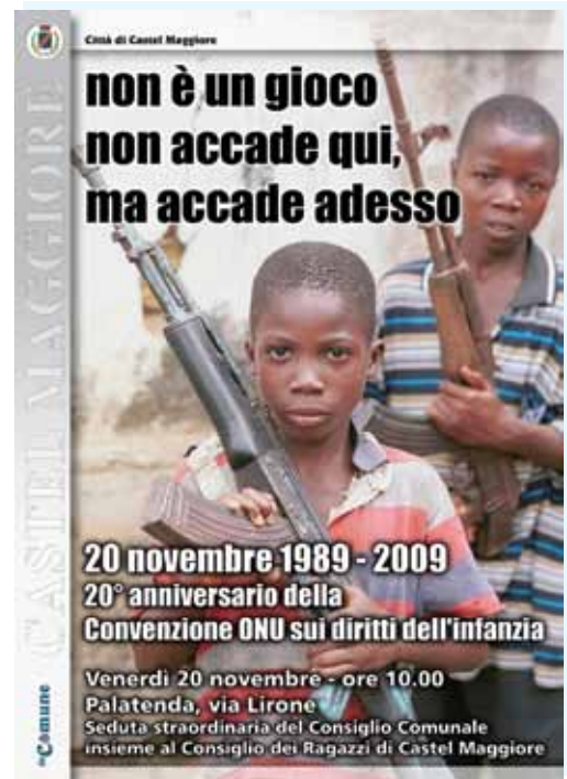
Il manifesto realizzato dall'Amministrazione Comunale per il ventennale della convenzione ONU sui diritti dell'infanzia

Nel nostro paese l'ISTAT ha registrato impietosamente il calo della propensione al risparmio, del potere d'acquisto, dei consumi, del reddito risparmiato: sono i segnali del disagio delle famiglie - e noi li abbiamo avvertiti non tanto e non solo dalla lettura delle statistiche, ma attraverso i nostri sportelli comunali, per la crescita di domande per il contributo affitto, per la crescita di domande di revisione delle rette per i nostri servizi per gli anziani e l'infanzia, misurando nel concreto i problemi reali della crisi, guardando negli occhi le persone. Oggi siamo completamente immersi in questa situazione e i dati di prospettiva ci dicono che essa rischia di deteriorarsi ulteriormente: parlando in termini di posti di lavoro, l'OCSE dice che in Italia da qui alla fine del 2010 si perderanno altri 850.000 posti di lavoro: dovremmo lavorare per invertire questa tendenza, non con ottimismo di facciata e buoni propositi, ma con azioni incisive. Di fronte alla crisi economica, noi saremmo ben lieti di poter dare risposte concrete alle richieste pressanti degli imprenditori e dei lavoratori, ma credo che non sfugga a nessuno il quadro eco-