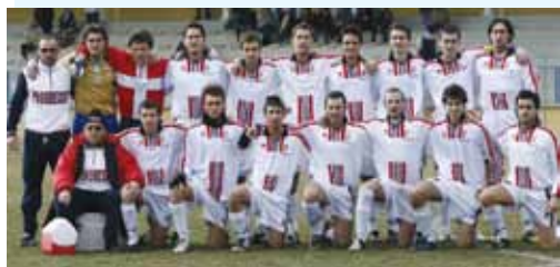
Il Progresso Calcio