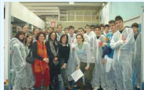
Laboratorio di intercultura al Keynes