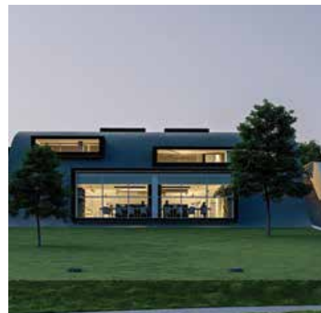
Una prospettiva dal progetto di nuova biblioteca

Le misure anti-Covid, con conseguente lockdown, hanno interrotto le progettualità, costringendo a reinventare le prassi in corso, usando canali digitali. La biblioteca ha cercato di sostenere queste attività, creando delle rubriche settimanali nelle nostre pagine facebook e nella pagina creata per i servizi bibliotecari sul sito della Reno Galliera, dedicate ai più piccoli: dai consigli di ascolto di letture alla radio, alla segnalazione di siti dove trovare letture e