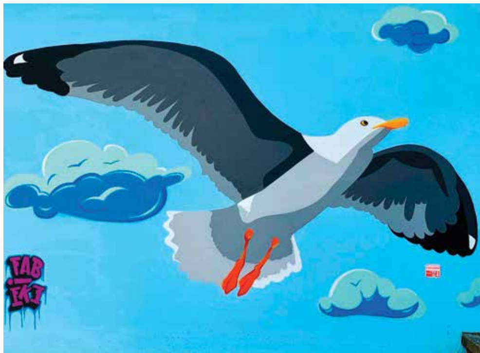
Castel Maggiore più bella: l'ultimo lavoro di Fabieke alle scuole Bertolini