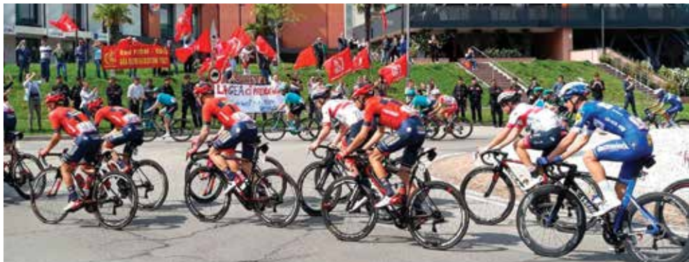
La protesta dei lavoratori GEA al Giro d'Italia

Tavolo di salvaguardia riconvocato per la metà di luglio