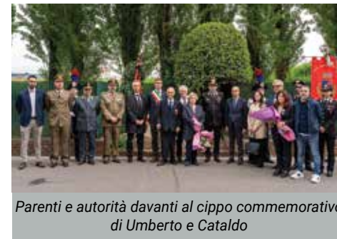
Parenti e autorità davanti al cippo commemorativo di Umberto e Cataldo

Il Comandante provinciale dei Carabinieri, le rappresentanze di Prefettura, Questura, Esercito, Guardia di Finanza, Vigili del Fuoco, Polizia Locale, Protezione Civile, il senatore Croatti, insieme al Sindaco Vignoli e all'amministrazione comunale si