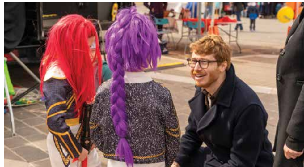
La Festa della Raviola 2026

Sulla stessa lunghezza d'onda si trova l' Edilizia Residenziale Sociale (c.d. ERS), ossia continua →