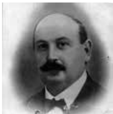
Roberto Carati, sindaco di Castel Maggiore al tempo della prima guerra mondiale