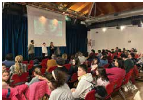
La presentazione del film Lorax con il Consiglio delle Ragazze e dei ragazzi, il 21 marzo scorso

Quest'anno è tornato il cinema a Castel Maggiore: una stagione con sei proiezioni tra febbraio ed aprile, pensate per accompagnare il pubblico durante i mesi invernali e primaverili e offrire occasioni di incontro e condivisione negli spazi culturali della città. La Vicesindaca Maria Vittoria Cassaneli spiega: "Il calendario ha proposto una selezione eterogenea di film, che spaziava da titoli recenti a opere già affermate, con l'obiettivo di offrire serate di cinema accessibili e di qualità, capaci di valorizzare il teatro come luogo di socialità e partecipazione". Da "La zona di interesse a l'uomo che verrà, passando per Lorax e Superman , la rassegna ha incrociato eventi del calendario civico e iniziative come il Festival dell'albero.