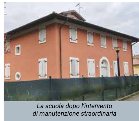
La scuola dopo l'intervento di manutenzione straordinaria

Ora sono stati realizzati diversi interventi di rinforzo, tra cui il consolidamento della copertura in legno, il miglioramento dei collegamenti tra travi e murature, il rafforzamento di alcune pareti mediante fibre di carbonio e la realizzazione di cerchiature metalliche su alcune aperture del piano terra. È stato anche realizzato un intonaco armato sulle pareti esterne, soluzione che ha permesso di intervenire senza modificare le superfici interne interessate dalla presenza di impianti radianti.