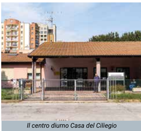
Il centro diurno Casa del Ciliegio

autonomia o disabilità. L'obiettivo è favorire la permanenza nel proprio ambiente di vita attraverso l'integrazione socio-sanitaria e l'accesso a servizi domiciliari, semiresidenziali o residenziali.