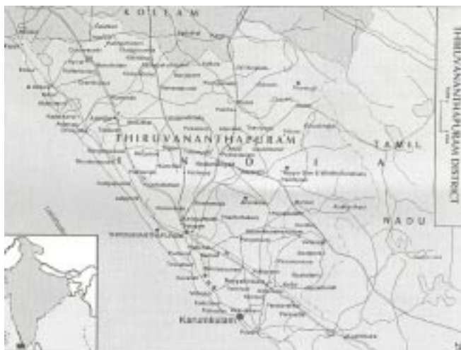
Karumkulan, Stato del Kerala, India