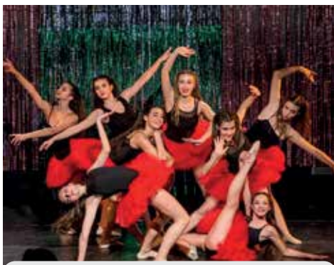
Grand Jeté in azione

Grand Jetè Dance Academy e Progetto danza D.E.F. sono le scuole di danza attive sul territorio. Grand Jeté, oltre ai corsi di danza e alla nuova attività di pilates, tra le altre cose propone nel 2023 un Seminario delle arti coreutiche con insegnanti di danza, musica e teatro coinvolti in un campus estivo a Villa Salina, dove si terrà anche Villa Salina Malpighi in danza. La scuola di musica Musicalia lancia una rassegna di tre concerti, i Grigiore riscuotono grande successo con il teatro dilettaile, il Collettivo teatrale Raptus oltre al corso di teatro lavorerà ad un nuovo progetto su Catullo, l'Associazione Hobbyart rimane